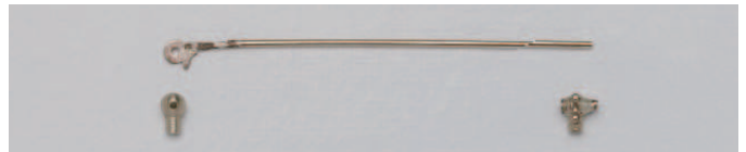
07-10 WG ブローチ金具セット(風車)