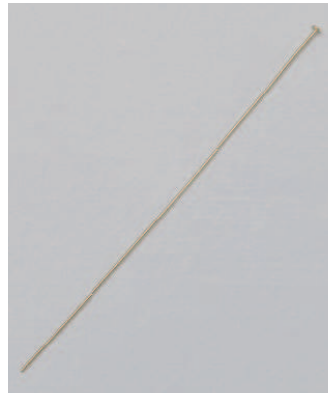
07-02 K18 WG 60mm