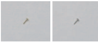
07-03 K18 WG 穴留め