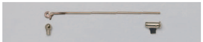
07-12 WG ブローチ金具セット(鉄砲)