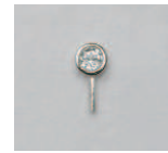
07-06 SV プレートパー