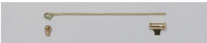
07-11 K18 ブローチ金具セット(鉄砲)