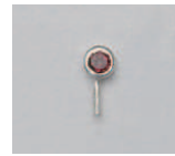
07-05 SV ガーネット