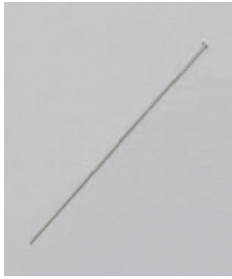
07-01 K18 WG 50mm