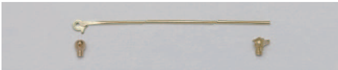
07-09 K18 ブローチ金具セット(風車)