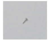
07-07 RM 穴留め