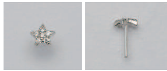
07-04 WG 星